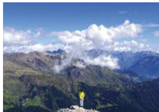
Pizzo Arera Angelo Corna