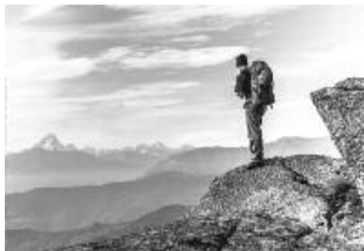
Al cospetto del Re Luciano Fochi