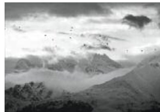
In volo sulle Alpi Federico Milesi