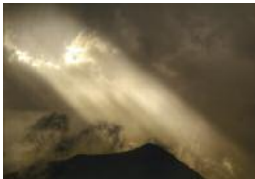
Radius from the sky Federico Milesi