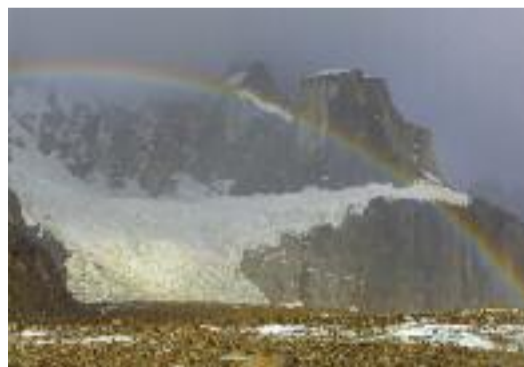
Caleidoscopio di colori sul ghiacciaio del Cerro Torre Sergio De Leo