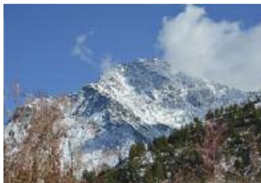
La Rognosa e la prima neve Vittorio Gribaudi