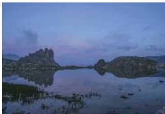
Tramonto dal Lac Blanc verso la Val Susa Alberto Casse