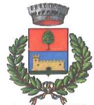
Comune di Olmo Gentile