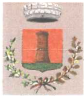
Comune di Roccaverano